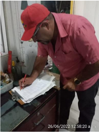
26/06/2022 12:58:20 a. m.