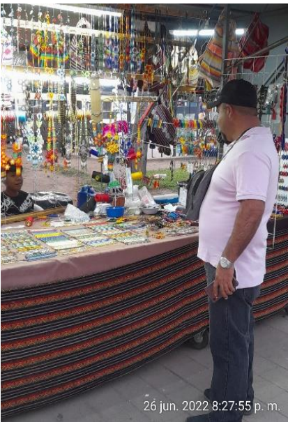
26 jun. 2022 8:27:55 p. m.